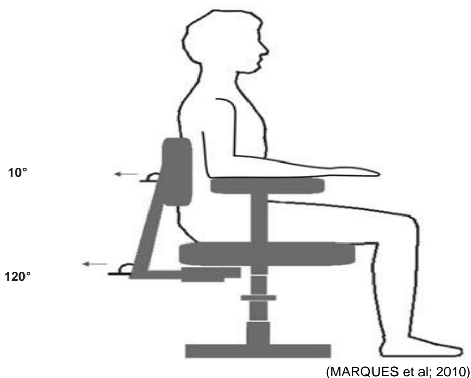
Figura 3 Adaptações ergonômicas na cadeira de escritório.

no máximo 10° inclinada para trás (Figura 3). A altura exata do assento deve ser menor que a distância do joelho ao pé, o que acaba com a pressão na fossa poplíteia. Os encostos devem estar um pouco abaixo dos ombros (pelo menos 6 cm) para evitar que ocorra extensão na coluna lombar com um consequente aumento na lordose dessa região, gerando assim anteriorização da vértebra L5 (MARQUES et al; 2010).