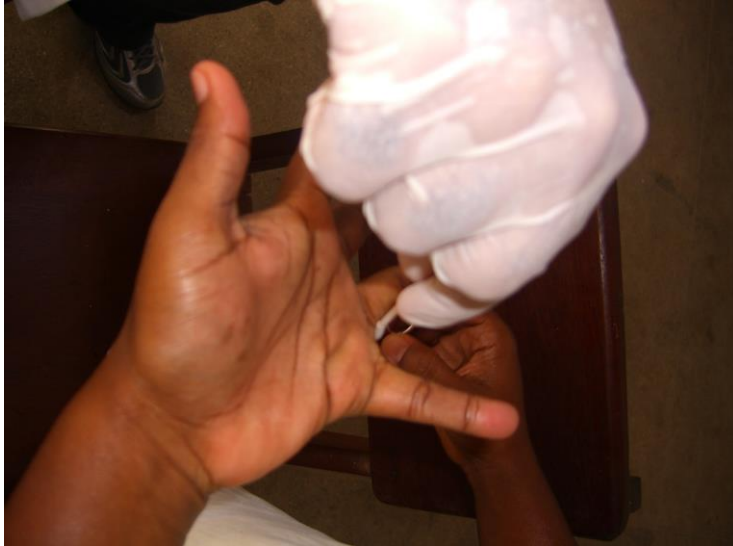
Imagem 3. Coleta pelo método de swab de manipulador que usava aliança.