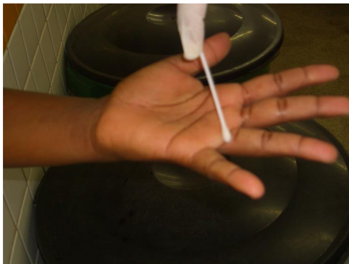
Imagem 1. Coleta utilizando o método de swab .