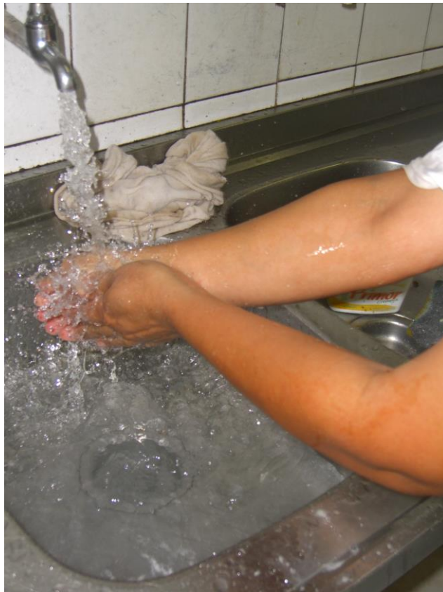
Imagem 4. Manipulador realizando a lavagem das mãos.