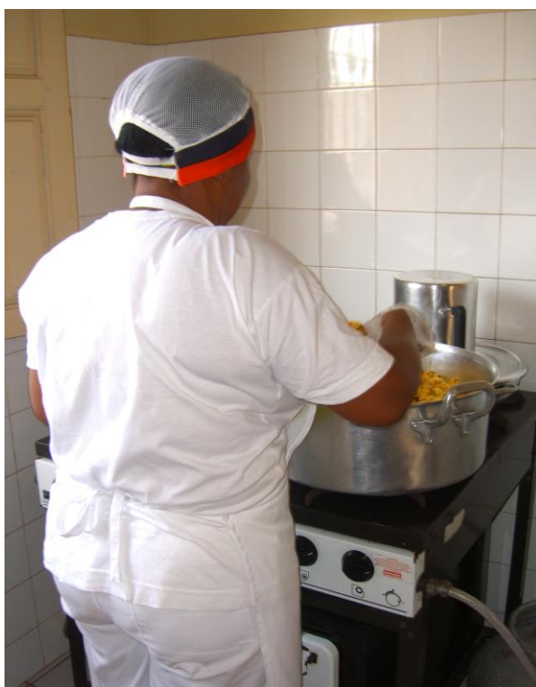
Imagem 2. Manipulador de alimentos de uma escola em São Luís.