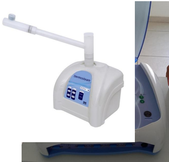
Dermosteam – vapor de ozônio Neurodyn Esthetic Ibramed