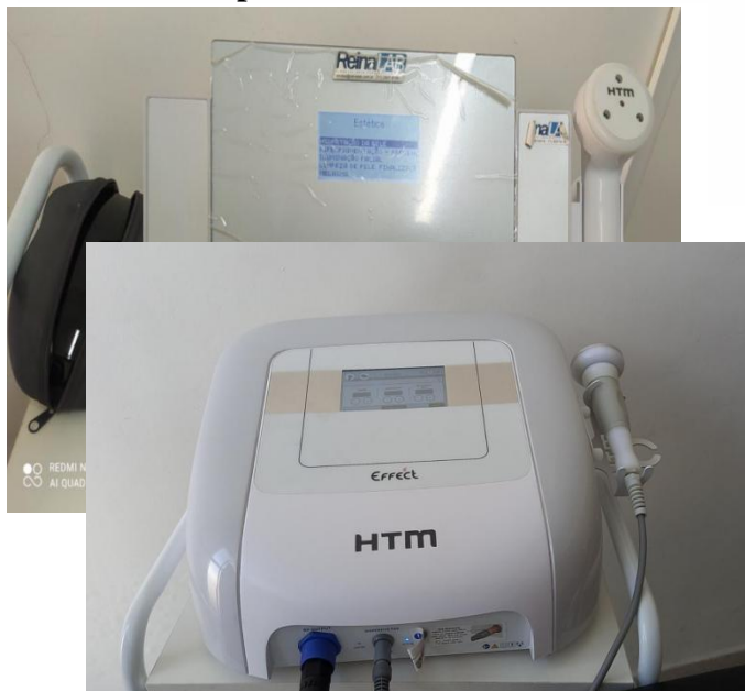
Effect HTM - Radiofrequência