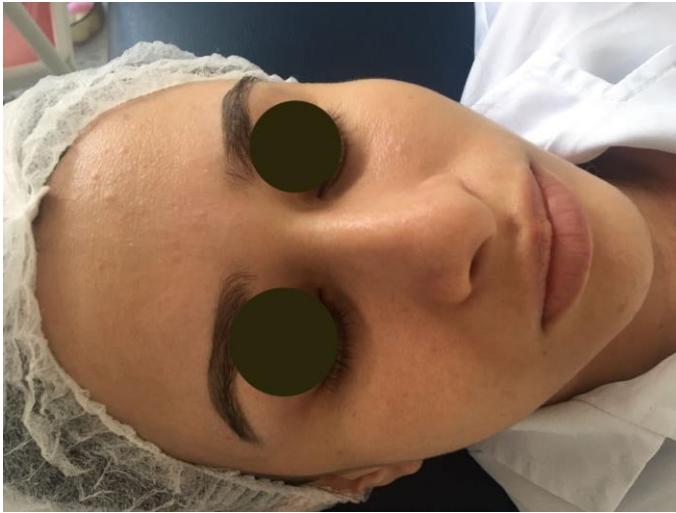
Foto após limpeza de pele com argila branca