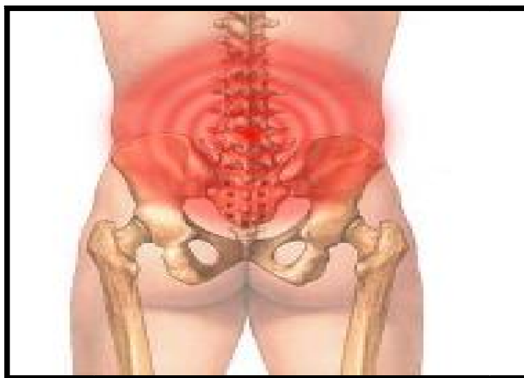
FIGURA 02: Representação da sintomatologia da lombalgia.

A respeito deste aspecto temporal incorrente na referida manifestação patológica, Lorenzetti (2006, p. 77) destaca que, “as articulações da coluna vão se desgastando, podendo levar à degeneração dos discos intervertebrais e que apesar da recuperação, há tendência de recorrência dos sintomas dolorosos, que também pode ter como causas anormalidades vasculares, neuromodulação da dor ou fatores psicossociais” .